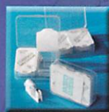
Cassette et Cartouche